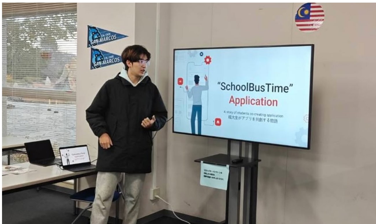
【英語サークル「Global Communication Club」で アプリ「SchoolBusTime」を紹介】

福山大学での4年間は、私にとってかけがえのない時間でした。電気電子分野の専門知識を深める中で、授業で学んだ知識を活かし、直近のスクールバスの発着時刻を検索できるスマートフォンアプリ「SchoolBusTime」を開発しました。このアプリは、留学生だけでなく日本人学生にも広く利用され、キャンパスライフの利便性向上に貢献しました。また、英語サークル「Global Communication Club」にも参加し、英語力を高めることができました。SICE学会発表にも何度か挑戦させていただき、教室で学んだ知識を実際のアウトプットとして発表できた経験は、大きな自信に繋がりました。