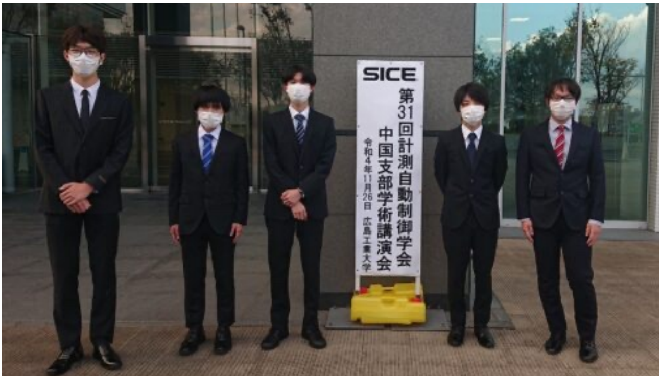
【第31回計測自動制御学会にて日本人学生と記念撮影】

これからも福山大学で培った力を土台に、大学院でもさらなる高みを目指して頑張りたいと思います。